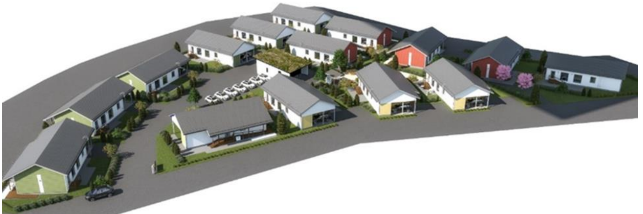
Myllylenkki 2, visualisoitu aluekuva