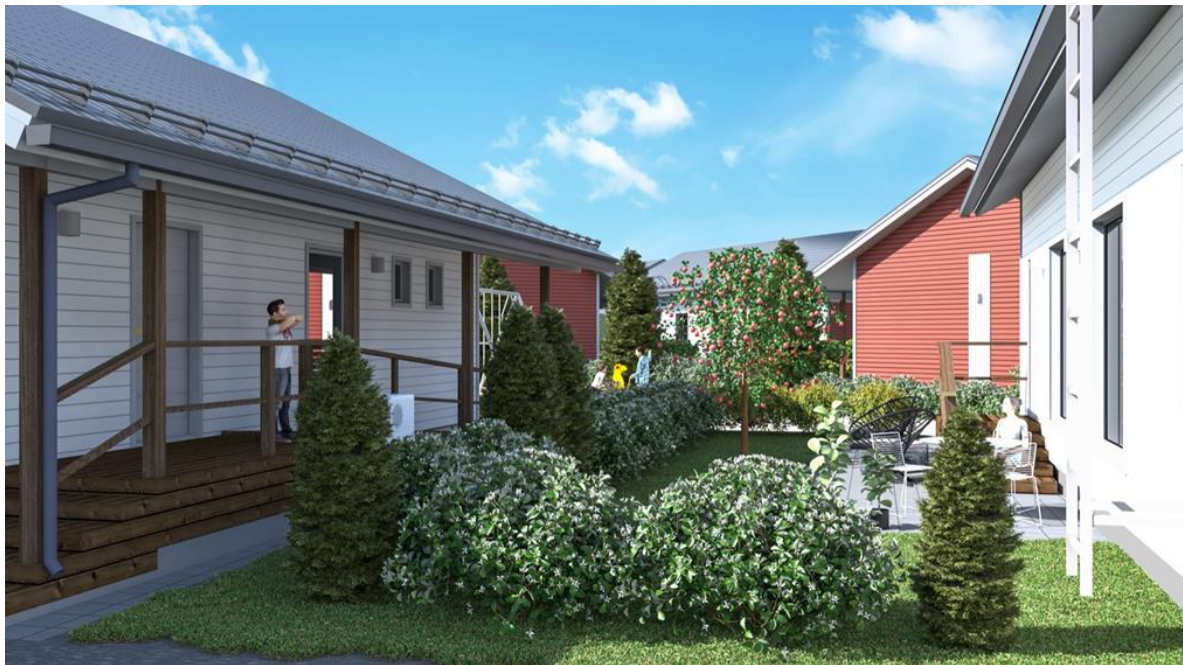
Myllylenkki 2, piha-aluevisualisointi

Pientaloalue sijaitsee Keravan pohjoisrajalla, noin neljän kilometrin päässä Keravan asemalta. Hyvät ulkoilumaastot ovat vieressä, sillä kotiovelta pääset suoraan luontoympäristöön. Kauppa, päiväkotia ja koulu ovat kolmen kilometrin säteellä alueesta.