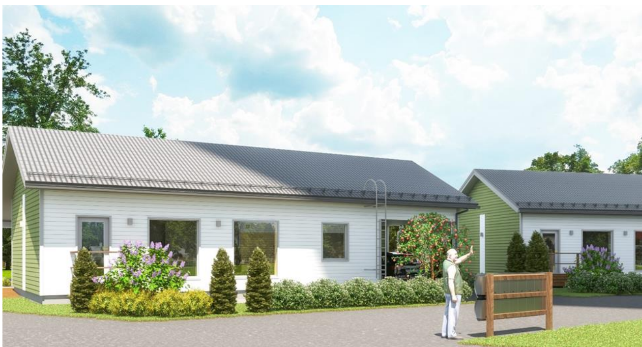
Myllylenkki 2, suuntaa-antava julkisivuvisualisointi